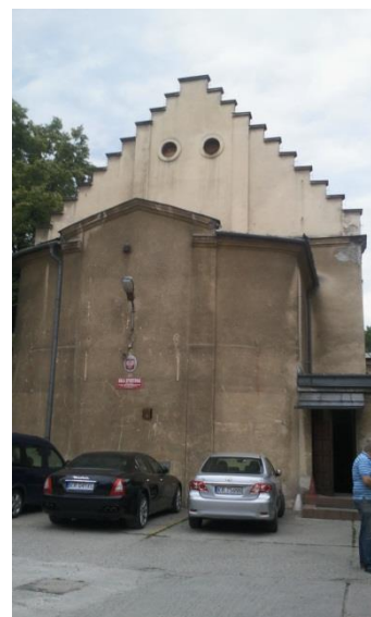
Siedziba Podgórskiego „Sokoła” Kraków ul Sokolska (widok z 2017)

Priorytetem Towarzystwa było posiadanie własnego lokum. Natychmiast podjęto się jego realizacji. Plan budowli będącej w przyszłości siedzibą Towarzystwa na terenie