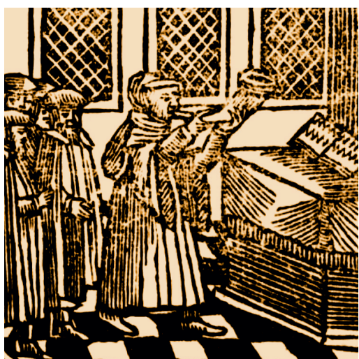
Sefer minhagim, Amsterdam 1723